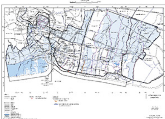
แผนผังแสดงผังน้ำ

ทั้งนี้ ภายหลังจากการประชุมรับฟังข้อคิดเห็นของประชาชนในวันดังกล่าว เมื่อคณะกรรมการผังเมืองจังหวัดให้ความเห็นชอบผังเมืองรวมสมุทรปราการ (ปรับปรุงครั้งที่ ๓) แล้ว องค์การบริหารส่วนจังหวัดสมุทรปราการจะดำเนินการปิดประกาศแผนที่แสดงเขตและรายละเอียดของผังเมืองรวมเป็นเวลาไม่น้อยกว่าเก้าสิบวัน เพื่อให้ผู้มีส่วนได้เสียไปตรวจดูแผนผังและข้อกำหนดของผังเมืองอีกครั้งหนึ่ง แต่อย่างไรก็ตาม หากผู้มีส่วนได้เสียที่ประสงค์จะยื่นคำร้องในระยะเวลาการปิดประกาศไม่น้อยกว่าเก้าสิบวันดังกล่าว จะต้องยื่นคำร้องแสดงความเห็นเกี่ยวกับข้อกำหนดการใช้ประโยชน์ที่ดิน พร้อมสงวนสิทธิเป็นหนังสือไว้ในวันประชุมรับฟังความคิดเห็นของประชาชนหรือภายในระยะเวลาที่กำหนดให้แสดงข้อคิดเห็นเป็นหนังสือ มิฉะนั้นผู้มีส่วนได้เสีย จะไม่สามารถใช้สิทธิในการยื่นคำร้องขอแก้ไขเปลี่ยนแปลง หรือยกเลิกข้อกำหนดการใช้ประโยชน์ที่ดินของผังเมืองรวมสมุทรปราการ (ปรับปรุงครั้งที่ ๓) ในภายหลังก่อนนี้ หนังสือคำร้องพร้อมการสงวนสิทธิดังกล่าวให้ส่งไปยังสถานที่ตามที่ได้กล่าวไว้ข้างต้น