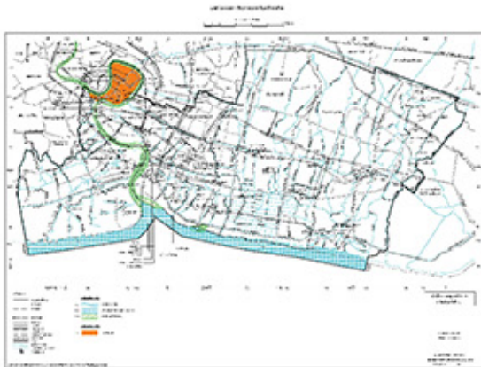
แผนผังแสดงแหล่งทรัพยากรธรรมชาติ และสิ่งแวดล้อม