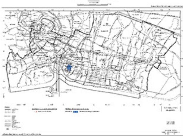
แผนผังแสดงโครงการ กิจการสาธารณูปโภค สาธารณูปการ และบริการสาธารณะ (ลักษณะที่ ๒)