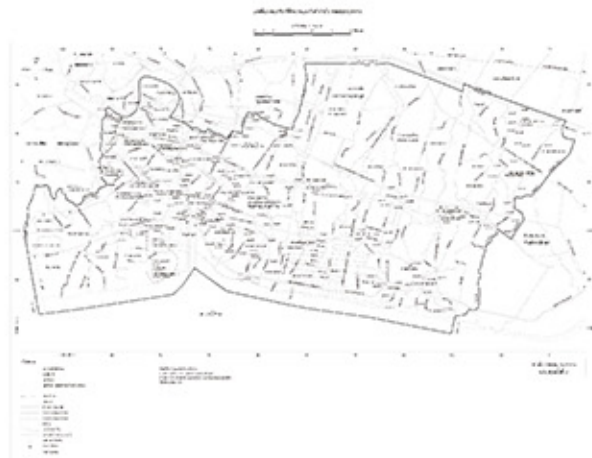
แผนที่แสดงเขตของผังเมืองรวม