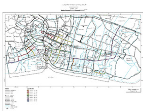
แผนผังแสดง