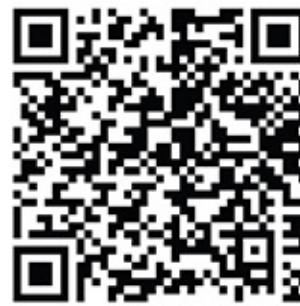
สถานที่ปิดประกาศ

ทั้งนี้ ภายหลังจากการประชุมรับฟังข้อคิดเห็นของประชาชนในวันดังกล่าว เมื่อคณะกรรมการผังเมืองจังหวัดให้ความเห็นชอบผังเมืองรวมสมุทรปราการ (ปรับปรุงครั้งที่ ๓) แล้ว องค์การบริหารส่วนจังหวัดสมุทรปราการจะดำเนินการปิดประกาศแผนที่แสดงเขตและรายละเอียดของผังเมืองรวมเป็นเวลาไม่น้อยกว่าเก้าสิบวัน เพื่อให้ผู้มีส่วนได้เสียไปตรวจดูแผนผังและข้อกำหนดของผังเมืองอีกครั้งหนึ่ง แต่อย่างไรก็ตาม หากผู้มีส่วนได้เสียที่ประสงค์จะยื่นคำร้องในระยะเวลาการปิดประกาศไม่น้อยกว่าเก้าสิบวันดังกล่าว จะต้องยื่นคำร้องแสดงความเห็นเกี่ยวกับข้อกำหนดการใช้ประโยชน์ที่ดิน พร้อมสงวนสิทธิเป็นหนังสือไว้ในวันประชุมรับฟังความคิดเห็นของประชาชนหรือภายในระยะเวลาที่กำหนดให้แสดงข้อคิดเห็นเป็นหนังสือ มิฉะนั้นผู้มีส่วนได้เสีย จะไม่สามารถใช้สิทธิในการยื่นคำร้องขอแก้ไขเปลี่ยนแปลง หรือยกเลิกข้อกำหนดการใช้ประโยชน์ที่ดินของผังเมืองรวมสมุทรปราการ (ปรับปรุงครั้งที่ ๓) ในภายหลังก่อนนี้ หนังสือคำร้องพร้อมการสงวนสิทธิดังกล่าวให้ส่งไปยังสถานที่ตามที่ได้กล่าวไว้ข้างต้น