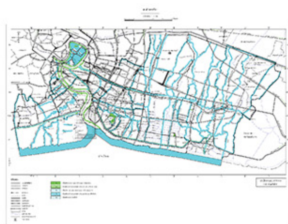
แผนผังที่ไล่