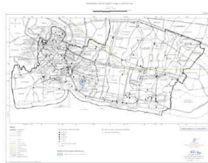
แผนผังแสดงโครงการกิจการ สาธารณูปโภค สาธารณูปการ และบริการสาธารณะ แผนผังหมายเลข ๒/๒