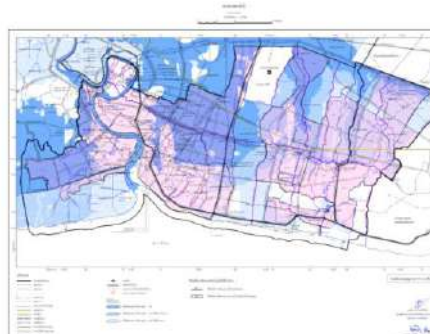
แผนผังแสดงผังน้ำ

ที่ทำการองค์การบริหารส่วนตำบลบางโฉลง ที่ทำการองค์การบริหารส่วนตำบลราชาเทวะ ที่ทำการ องค์การบริหารส่วนตำบลหนองปรือ สำนักงานเทศบาลเมืองพระประแดง สำนักงานเทศบาลเมืองลัด หลวง สำนักงานเทศบาลเมืองปู่เจ้าสมิงพราย ที่ทำการองค์การบริหารส่วนตำบลบางยอ ที่ทำการ องค์การบริหารส่วนตำบลบางกะเจ้า ที่ทำการองค์การบริหารส่วนตำบลบางน้ำผึ้ง ที่ทำการองค์การ บริหารส่วนตำบลบางกระสอบ ที่ทำการองค์การบริหารส่วนตำบลบางกอบัว ที่ทำการองค์การบริหาร ส่วนตำบลทรงคนอง สำนักงานเทศบาลตำบลพระสมุทรเจดีย์ สำนักงานเทศบาลตำบลแหลมฟ้าผ่า ที่ทำการองค์การบริหารส่วนตำบลนาเกลือ ที่ทำการองค์การบริหารส่วนตำบลบ้านคลองสวน ที่ทำการ องค์การบริหารส่วนตำบลแหลมฟ้าผ่า ที่ทำการองค์การบริหารส่วนตำบลในคลองบางปลากด สำนักงานเทศบาลตำบลบางเสาธง ที่ทำการองค์การบริหารส่วนตำบลบางเสาธง ที่ทำการองค์การ บริหารส่วนตำบลศีรษะจรเข้น้อย และที่ทำการองค์การบริหารส่วนตำบลศีรษะจรเข้ใหญ่ ตั้งแต่วันที่ ๑๖ กันยายน ๒๕๖๗ ถึงวันที่ ๑๖ ธันวาคม ๒๕๖๗