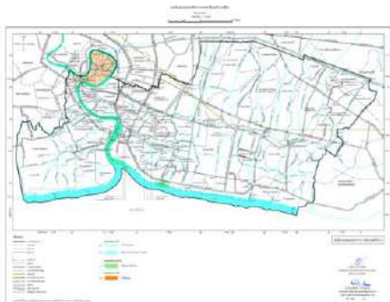
แผนผังแสดงแหล่งทรัพยากรธรรมชาติและสิ่งแวดล้อม