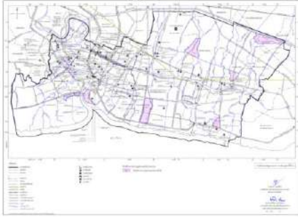
แผนผังแสดงโครงการกิจการ สาธารณูปโภค สาธารณูปการ และบริการสาธารณะ แผนผังหมายเลข ๑/๒