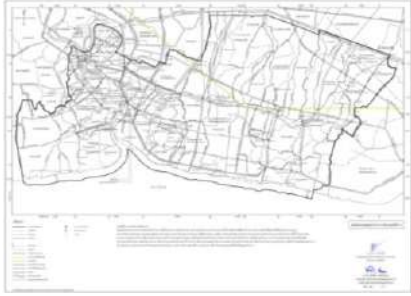
แผนที่แสดงเขตของผังเมืองรวม