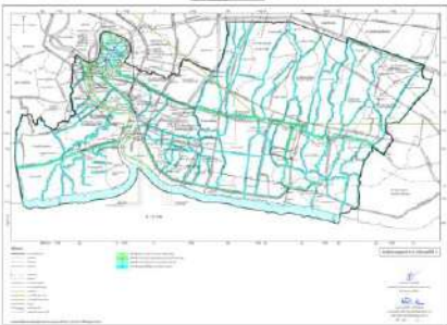
แผนผังแสดงที่โล่ง